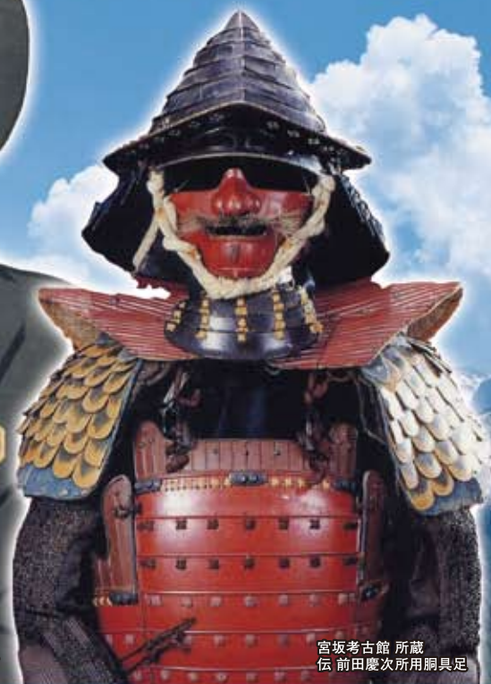
宮坂考古館 所蔵 伝 前田慶次所用胴具足