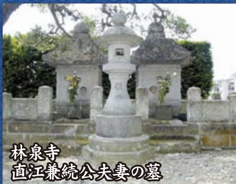
林泉寺 直江兼統公夫妻の墓