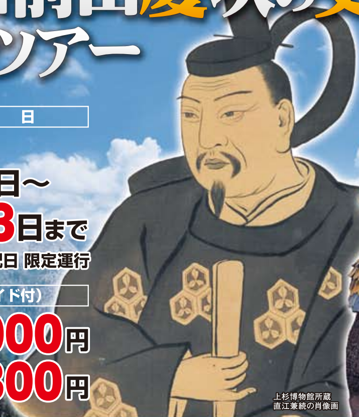
上杉博物館所蔵 直江兼統の肖像画