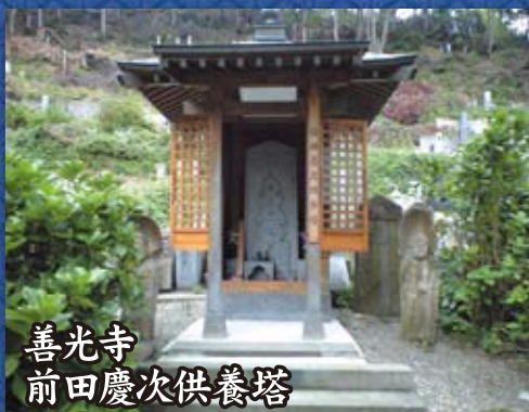
善光寺 前田慶次供養塔