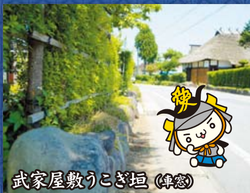
武家屋敷うこぎ垣 (俣窓)